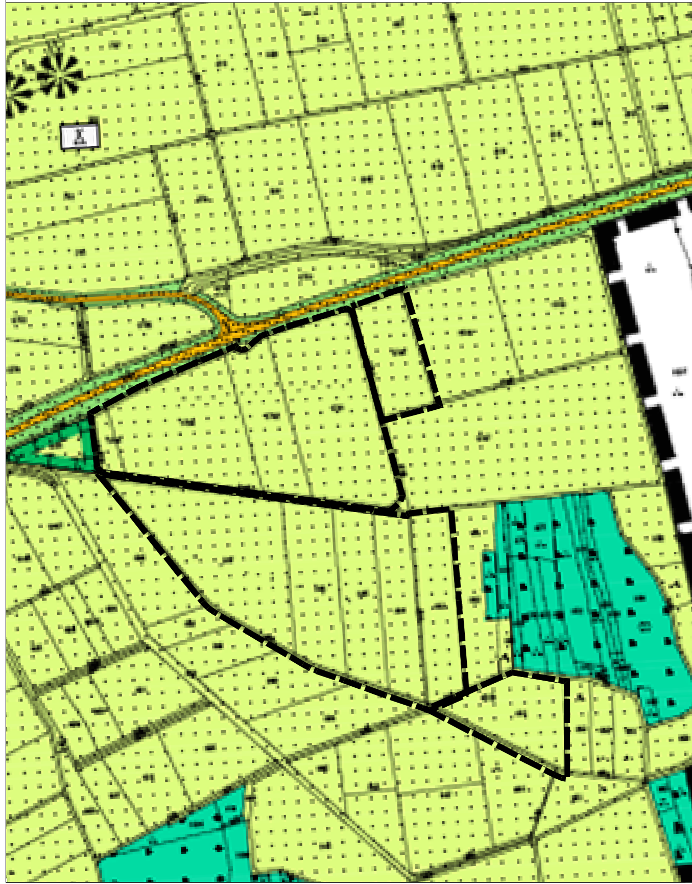
Kartengrundlage: Flächennutzungsplan (Scan)